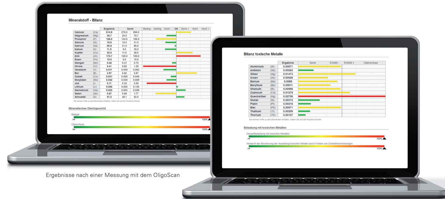
Ergebnisse nach einer Messung mit dem OligoScan

Unter Berücksichtigung mehrerer Gegebenheiten wie Alter, Grösse, Körpergewicht, Geschlecht und Blutgruppe wird gemessen, ob Ihr Gewebe ausgeglichene Konzentrationen der Mineralien und Spurenelemente aufweist. Ein Mangel oder ein Überschuss kann die optimale Zellregulation stören.